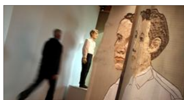
Stephan Balkenhol expose ses œuvres à Manderen.