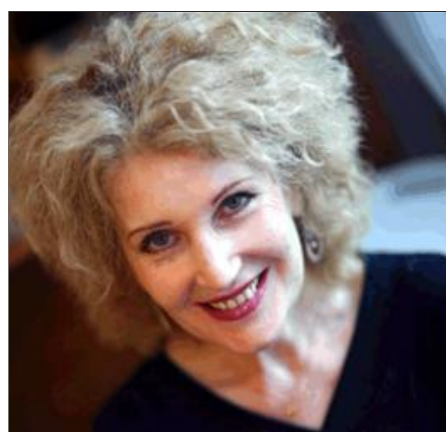
Talila proposera son Yiddish Blues ce soir à l'Adagio.