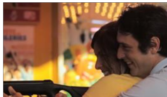
Valérie Donzelli et Jérémie Elkaim dans La Guerre est déclarée.